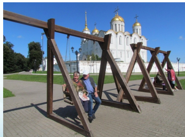
Маршрут по святым местам г. Владимира