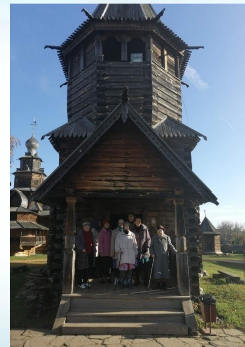
В музее деревянного зодчества