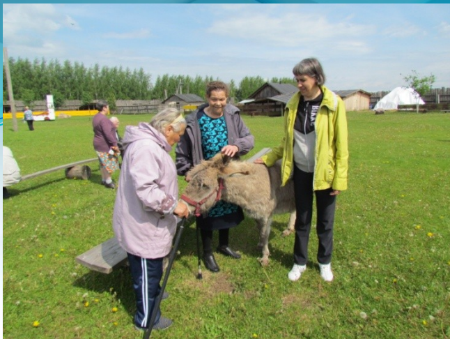
Экскурсия на звероферму с. Порецкое