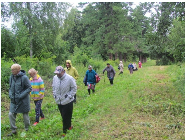
Пикник в кедровой роще с. Выпово