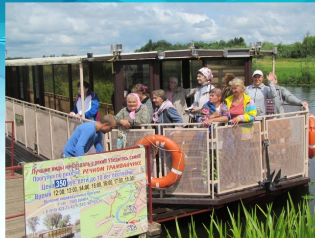
Прогулка на речном трамвайчике по реке Каменка